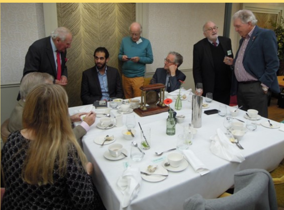
Fra et lunsjmøte i november 2023

På hjemmebane er de bl.a. engasjert i «Treekly», finansiering av treplanting, og konkurranser for å stimulere og støtte unge fotografer og unge kunstnere; fremme miljøbevissthet og redusere søppel, og sørge for ferie for unge som ellers ikke har muligheten. Lang erfaring kommer godt med: der en viktig inntektskilde er to «Charity Carol Concerts» tidlig i desember hvor hele ti skolekor pluss et kor av ukrainere som bor her, deltar. Britisk kor-tradisjon er som kjent enestående, kvaliteten skyhøy, og en «captive audience» i form av alle sangernes familie og venner sikrer utsolgte hus. I fjor fikk de inn over 200.000 kroner på disse konsertene, pluss moteshow. Alt dette viser, at selv om det kanskje er litt sterkt å hevde at dette er verdens beste Rotary-klubb, så går britisk erfaring og sterke tradisjoner i veldedighet og frivillig innsats, sammen om å skape et super-aktivt og meningsfylt fellesskap.