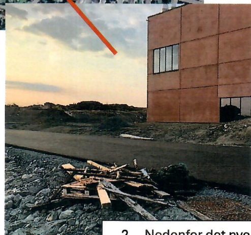
2. Nedenfor det nye kloakkrensaneanlegget på Tjøsvoll Vest (hentes når bommen er åpen)